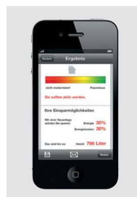
Energie-Spar-Check-App kostenlos im App Store!

Der Energie-Spar-Check liefert zunächst den aktuellen Energie-Kennwert Ihrer Heizung. Dann erfahren Sie, wie viel Sie mit einer neuen Heizung sparen – hochgerechnet auf zehn Jahre.